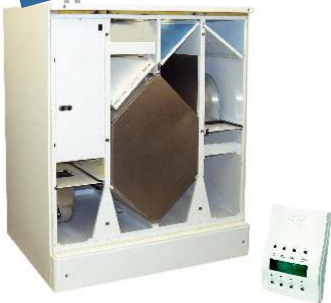
Przepływ powietrza Vallox 200 SE

— = Wentylator wyciągowy - - - = Wentylator nawiewny